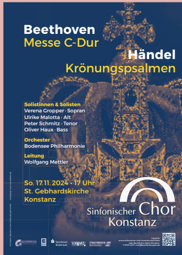
Das Plakat zum Konzert am 17. November 2024