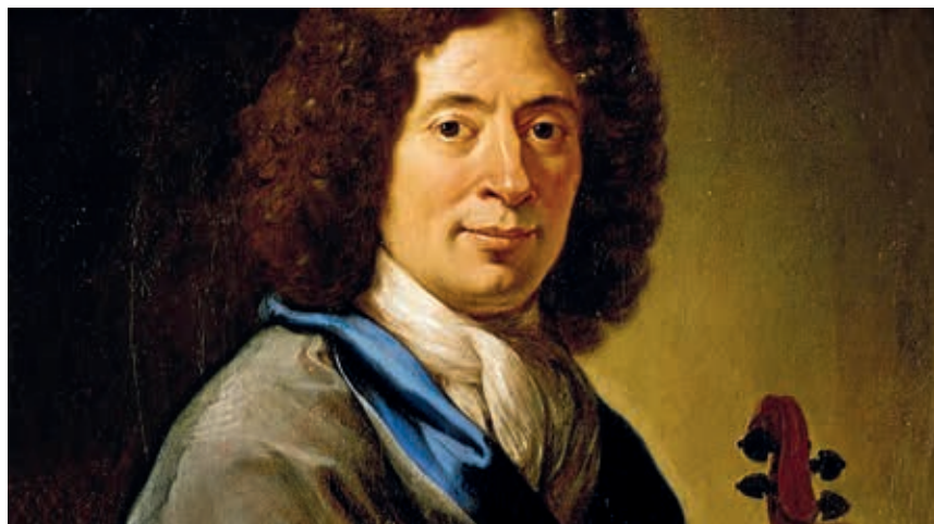
Arcangelo Corelli - Ölgemälde um 1697

die Botschaft von Weihnachten mit seinen auch tänzerischen Passagen. Corelli, selbst ein Violinvirtuose, erwarb sich mit diesem Concerto grosso für Streicher Weltruhm; es wurde damals regelmäßig auch auf dem Weihnachtsbankett im Vatikanspalast zwischen Vesper und Christmette aufgeführt.