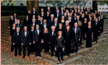
Der Sinfonische Chor am Konstanzer Münster im September 2024