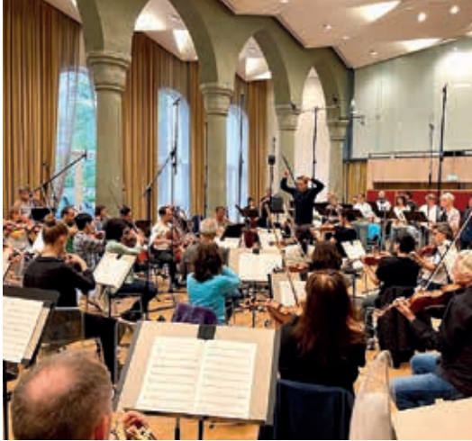
Die Bodensee Philharmonie bei der Ersteinspielung der Sinfonie Nr. 8 „Die Glocke“ im Juli 2024