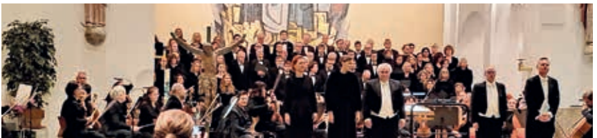
Alle Beteiligten erhielten nach dem Konzert begeisterten Applaus

dieser tollen Werke erarbeitet hat“, und der Stimmbildnerin Andrea Heizmann, „die nicht nachlassend uns immer wieder aufzeigt, wie wir einen noch schöneren und homogeneren Chorklang erreichen können“, für ihre engagierte Arbeit.