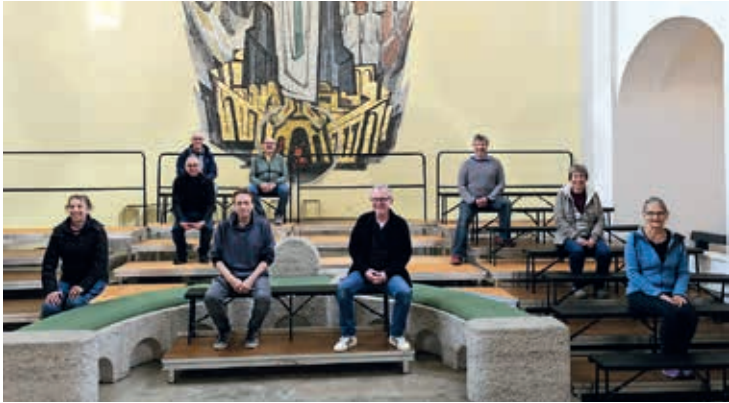
Neue Podestierung: Der Sinfonische Chor bei seiner ersten Sitzprobe in der Kirche St. Gebhard