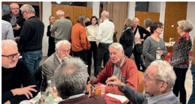
Vor Programmbeginn gab es anregende Gespräche zwischen aktiven und ehemaligen Chormitgliedern

Ein weiteres ereignisreiches Jahr geht zu Ende