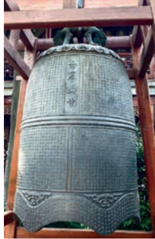
Die große Glocke im Hanshan Tempel in Suzhou (China)

ausdrücklich als Repräsentant des Jenseitigen und Göttlichen benannt wird, folgt das impulsive Finale des „Dona nobis pacem“, das von der Textzeile „Friede sei ihr erst Geläute“ aus Friedrich Schillers (1759-1805) Gedicht „Die Glocke“ eingeleitet wird.